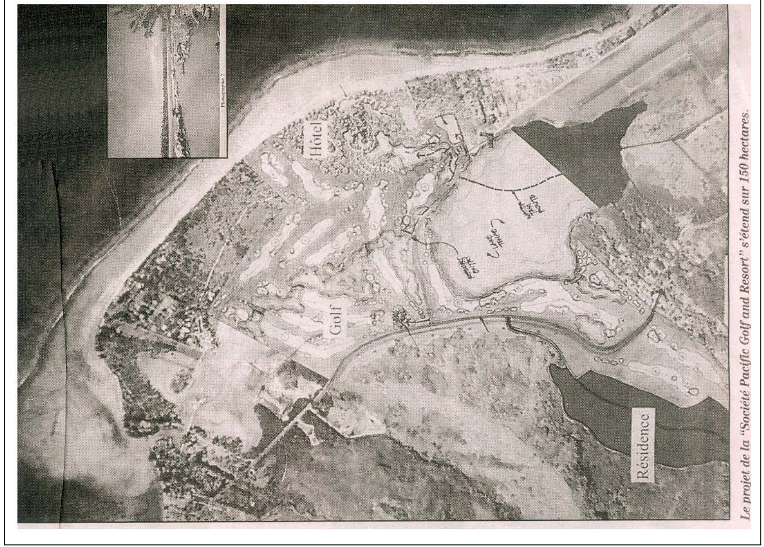
Le projet de la "Société Pacific Golf and Resort" s'étend sur 150 hectares.